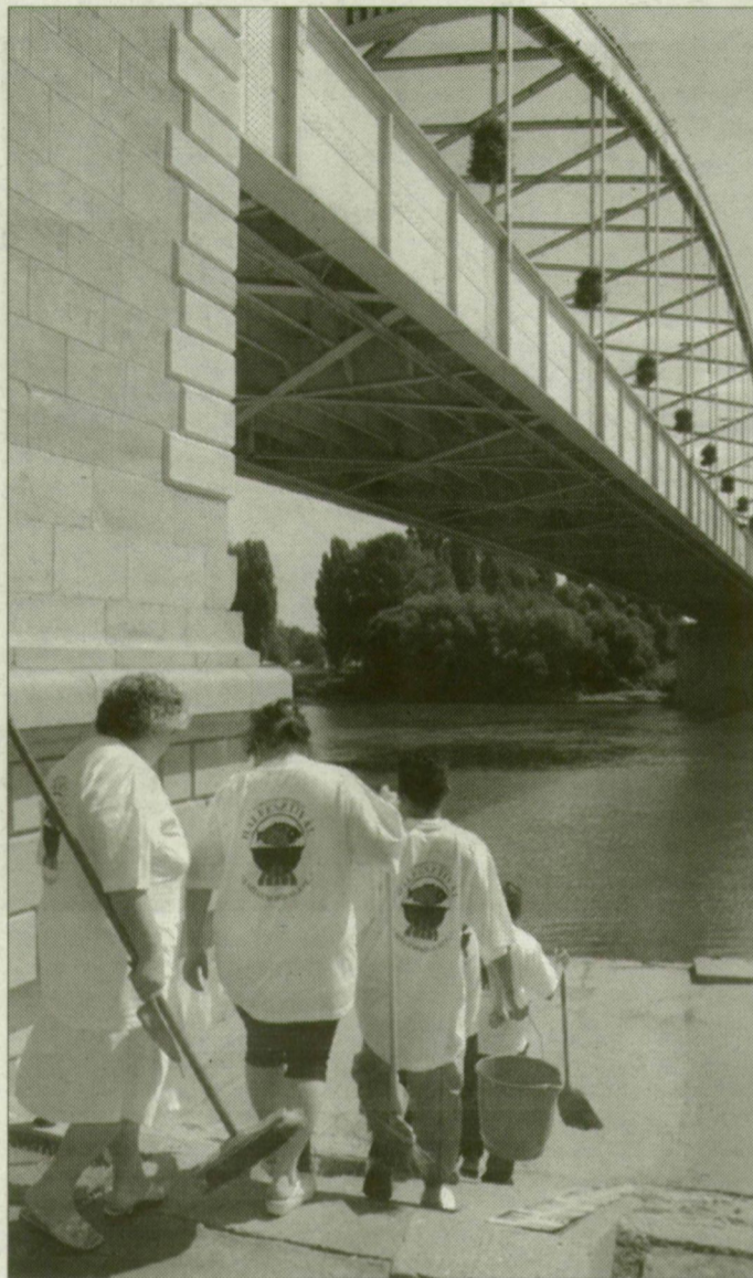
A takarítóasszonyok jutalma egy ajándék hallé

– Gyere el onnan! – kiáltottak többen. Rozika odébb lépett.