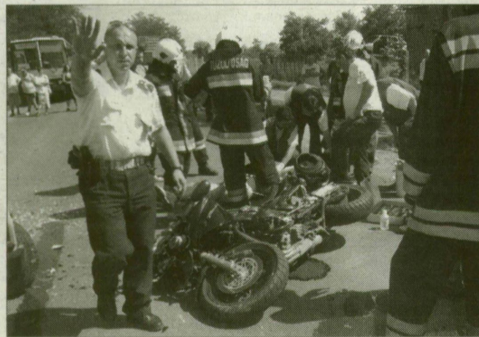
A mentősök hiába küzdöttek a motoros életéért