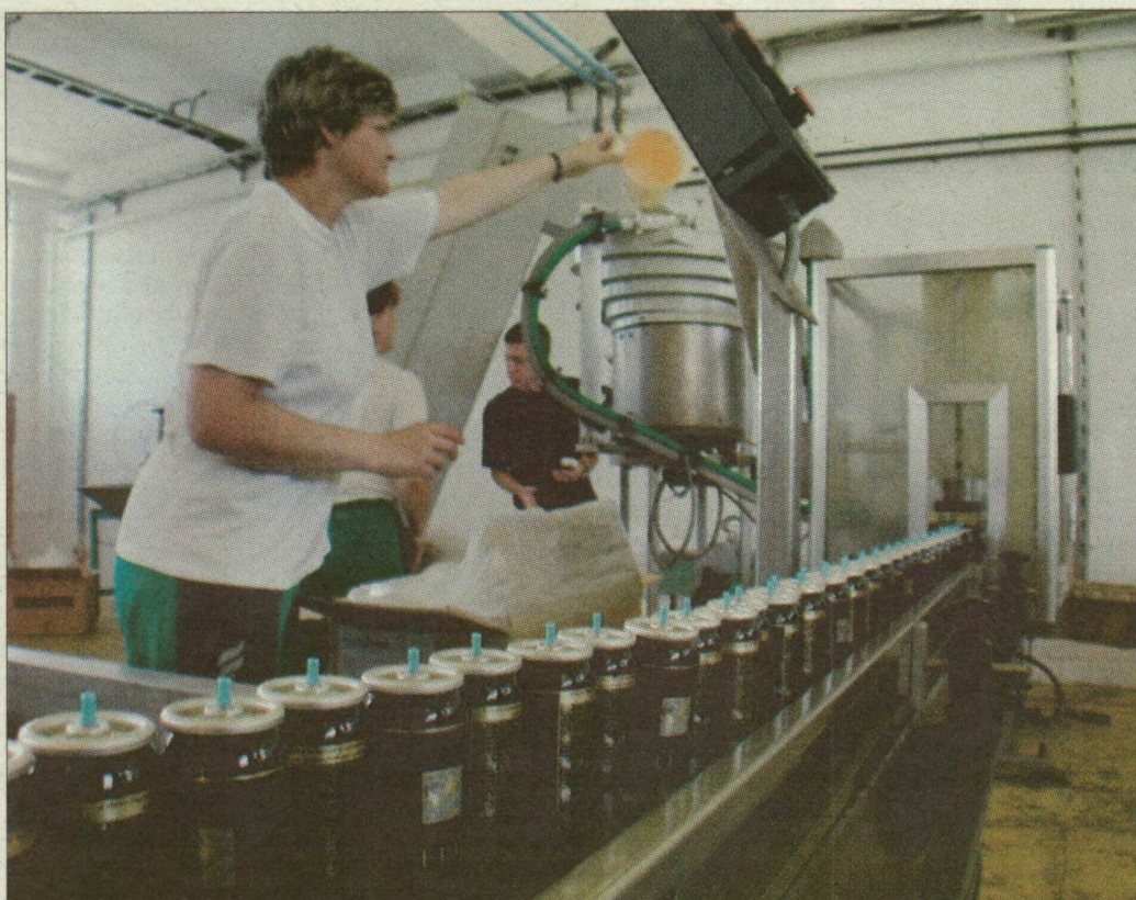
Palacktöltő sor az üzemben. Képünk illusztráció

Az ügy kirobbanásakor, 2003 májusában, a Florin Rt. el-