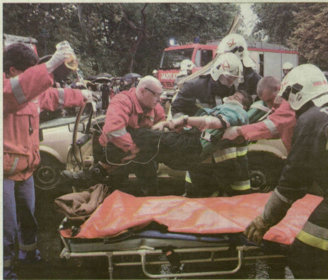
Tegnap sok veszélyes helyzetet szimuláltak a tűzoltók a bemutatón

„Tűzoltó leszél s katoná!” – biztosan sokszor szenderül álomba ezzel a mondattal az a kislány, aki egy „105” feliratú piros lufival sétálgatott tegnap a Széchenyi téren. Szeged hivatásos tűzoltósága az idén ünnepli fennállásának 125. évfordulóját, ebből az alkalomból rendeztek ünnepséget és tűzoltási bemutatót. Az ünnepi köszöntők után öt tűzoltót előléptettek, húszat pedig jutalomban részesítettek. A dél-