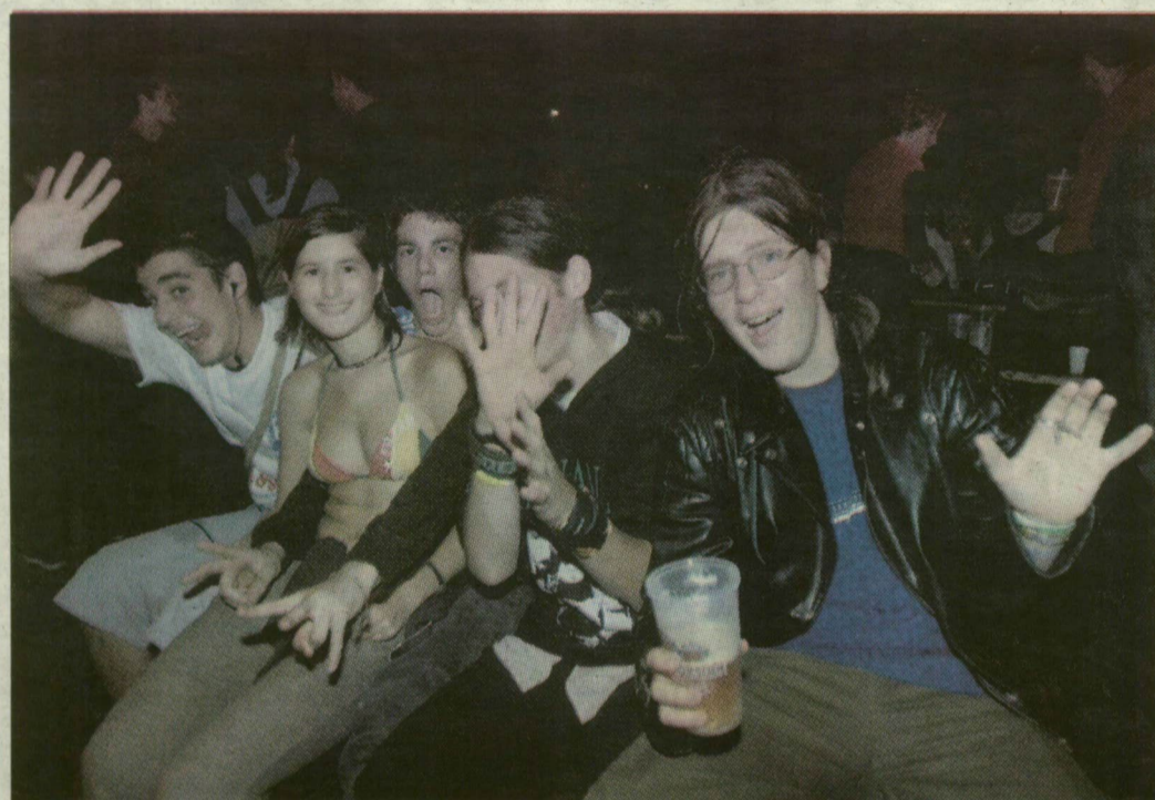
Sör és jókedv is jutott mindenkinek az esős éjszakában