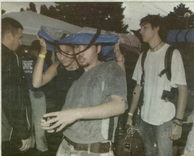
Zuhogó esőben is zajlott az élet