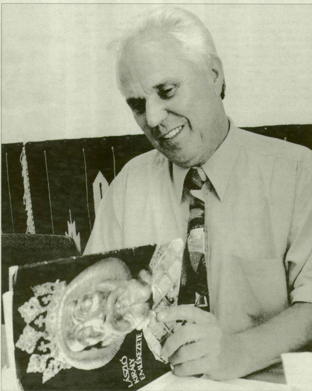
Makk Ferenc I. Lászlóról szóló kötettel. Kilencedik királyunk Szent István munkásságát kívánta folytatni

– Az ókeresztény időkben a vértanúk szentté avatása alapvetően egyházi célt szolgált: követendő példákat állítani a vallásos emberek elé. A későbbi időkben a szentté avatásoknak különös jelentőséget adott az, hogy – az egyházi jelleg változatlan érvénye mellett – a szentté avatásban közreműködő uralkodók politikai –