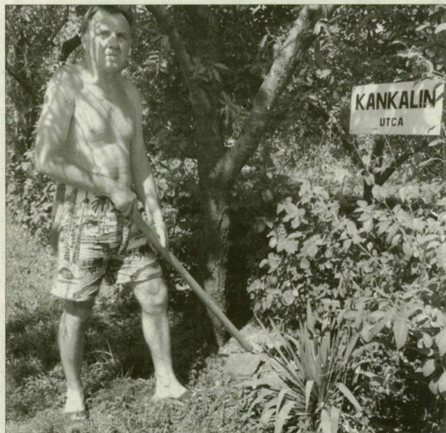
Bába Antal szerint a házzámosítás után fontos lenne az is, hogy a tápai kiskertes övezetet belterületté nyilvánítsák