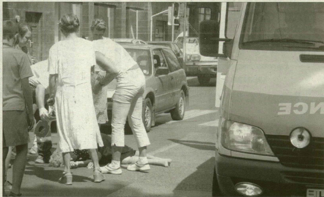
Az ütközés erejétől a szélvédőhöz csapódott, majd a földre zuhant az idős asszony