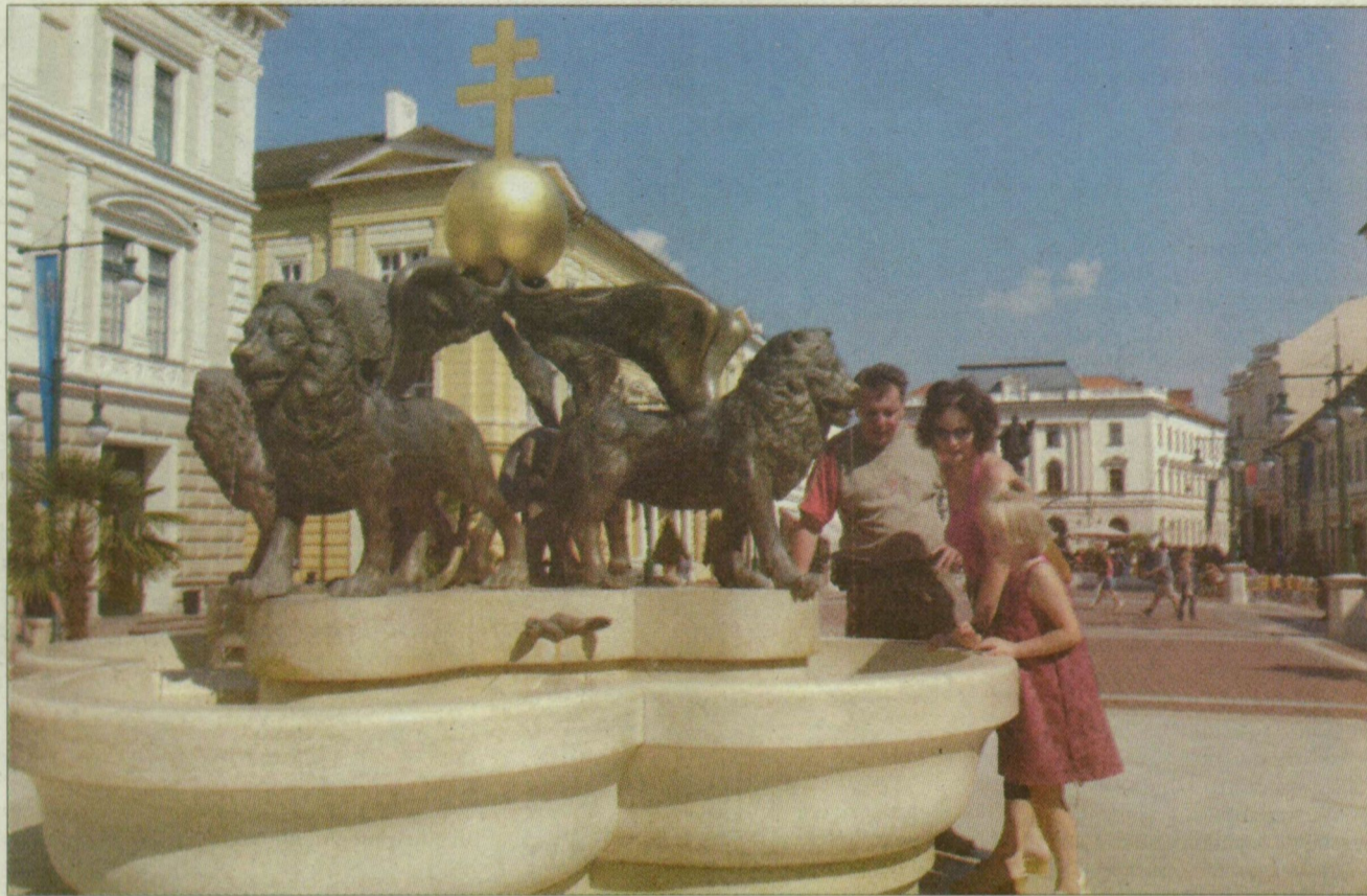
Az újrabútorozott Klauzál tér. A kiskörüton folytatódik a díszburkolat építése