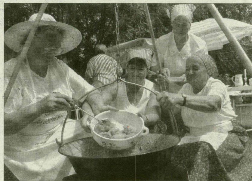
A mórhalmi Napfény Nyugdíjasklub tagjai disznótoros abaléval készítették a töltött káposztájukat