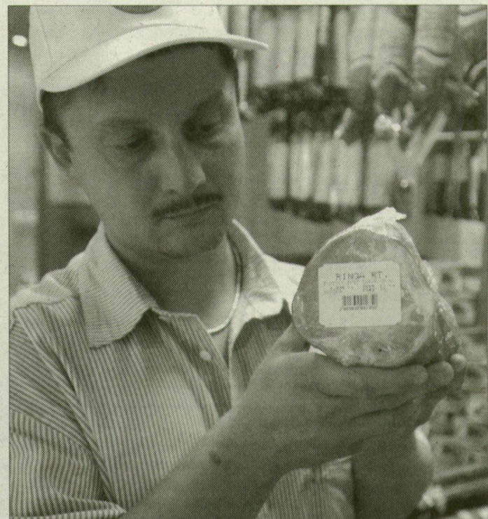
ILLUSZTRÁCIÓ: SZÜK ÖDÖN

azokat csomagolatlanul vagy csomagolva értékesítik.