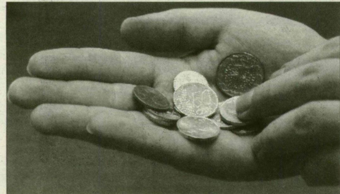
Euróérmék – siker vagy kudarc?

„A Bizottság sikerként könyveli el az euró első öt évét, s megelégedik arról, hogy az új pénz csökkentette a gazdasági növekedést, és fokozta a munkanélküliséget az euróövezet több országában. Az Európai Központi Bank kudarcot vallott, a pénzügyi szabályozás teljes káoszba fulladt. Aki mindezek ellenére úgy gondolja, hogy az euró működik, az nem a világból való” – nyilatkozta Ian Davidson brit parlamenti képviselő, az euróellenes mozgalom vezetője.