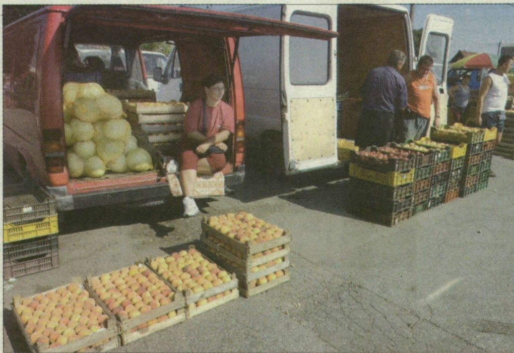
A termelők is örömmel fogadják az infrastruktúra fejlesztésének hírért

Az új felállással már lehetőség nyílik egy 600 millió forintos fejlesztésre, raktár, elárúsítóhely, búfé, térburkolat építésére. A termelők, a kereskedők és a térsz-ekek átvállalják a beruházási összeg felét, cserébe 20 évre szóló haszonbérleti jogot kapnak, s ter-