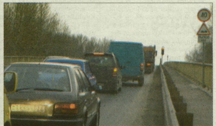
A dilatációk cseréje is torlódást okozott a 47-es úton. Hasonlóra számíthatnak az autósok