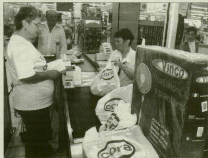
A szerencsés házaspárnak 20 ezer forint értékű áru került a bevásárlókocsijába