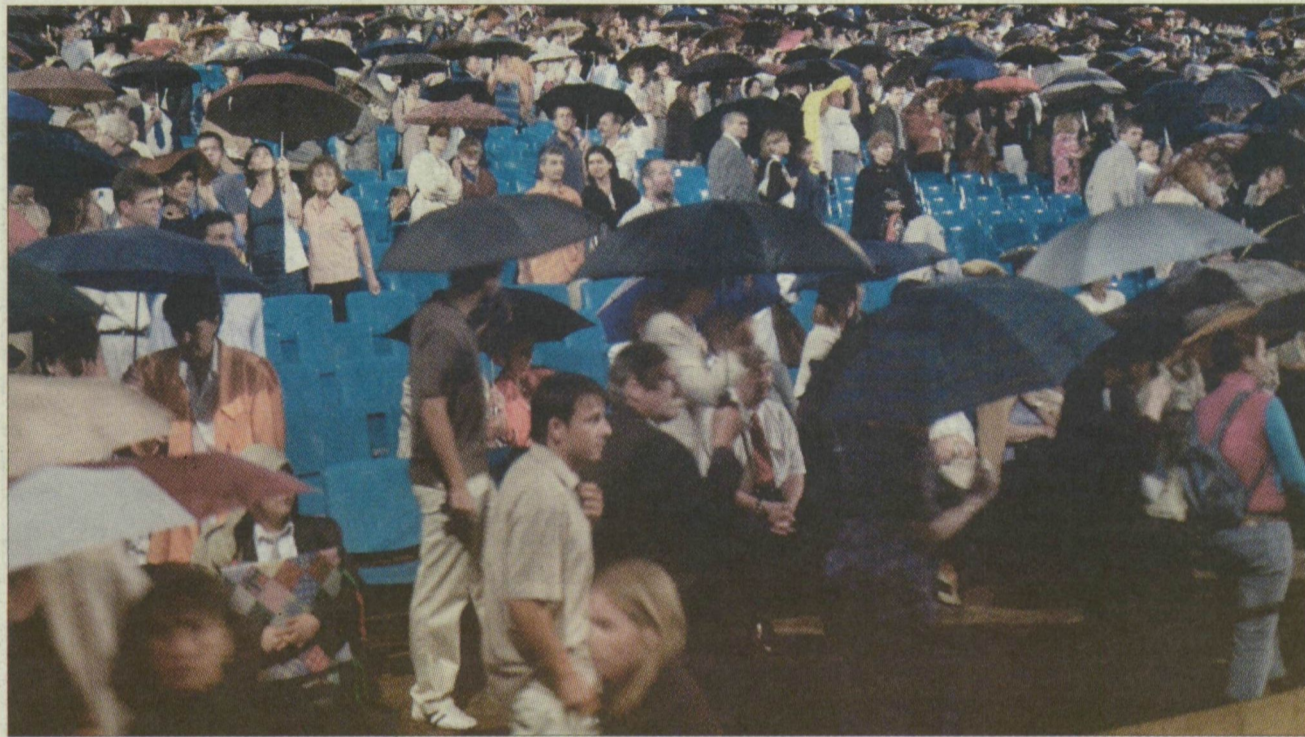
A nézők az esernyők alatt sokáig kitarítottak