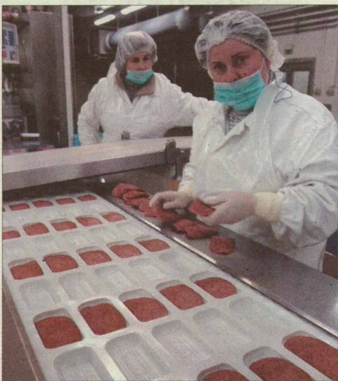
A Pickben zavartalanul csomagolnak tovább

A Bábolna Nemzeti Agrárholding Befektetési Rt. vezetésének birtokában eddig 200, termelők,