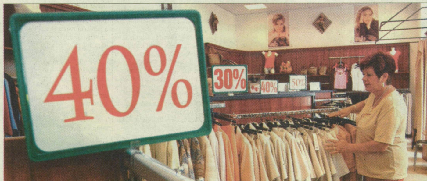
Szezonközépi százaléklécit a ruházati osztályon