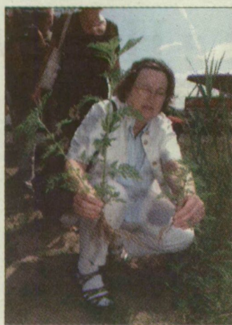
Parlagfű. Most virágzás előtt lekasálható.