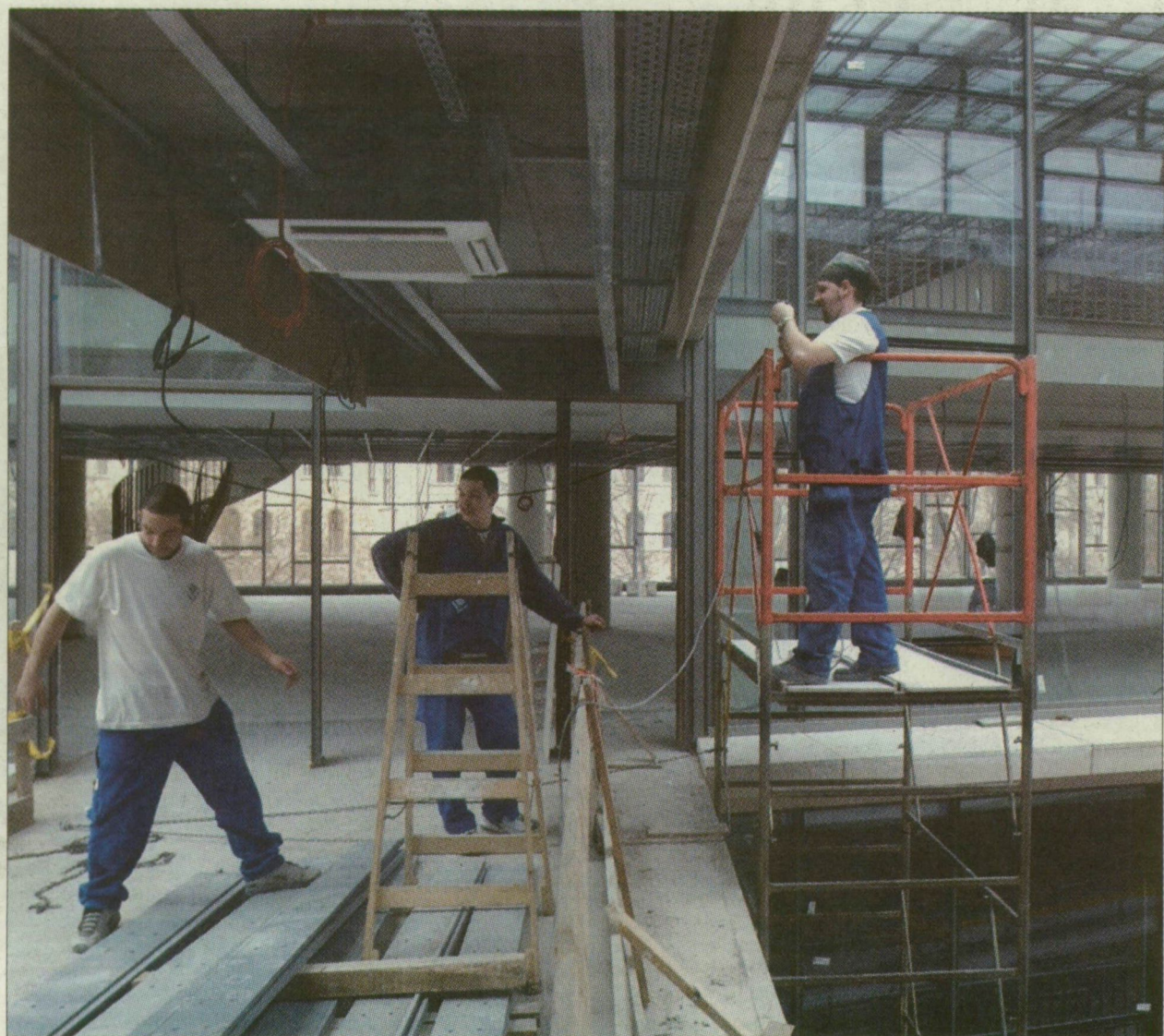
Munkások az Ady téri építkezésen. Nem rajtuk múlik a csúszás

A rendszerváltás után egymást érték az új és új ötletek. Míg nem 1966-ban elkészült egy valóságos terv és úgy volt, hogy a Világbank által folyósítandó felsőoktatás-fejlesztési hitelből megkezdődhet végre a könyvtárépítés a bölcsészkar épülete mögötti sportpályák helyén, az Ady téren. Idejötték a bankárok 1999-ben, kezükben az angolra fordított tervkoncepcióval, és mondták: jó