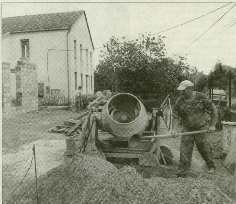
A tápai Bálint Sándor-iskola az eddigi háromból egy épületbe költözik.

A százmilliók karbantartáson felül az iskolák saját költségvetésükből költenek festésre, apróbb javításokra, de itt már sokféle forrásból származó pénzt használnak föl. Mindig akadnak szponzorok, szülői adományok, ingyenes munkafelajánlás, a családi nap és a tombola bevétele, plusz az önkormányzat erre szánt negyvenmilliója.