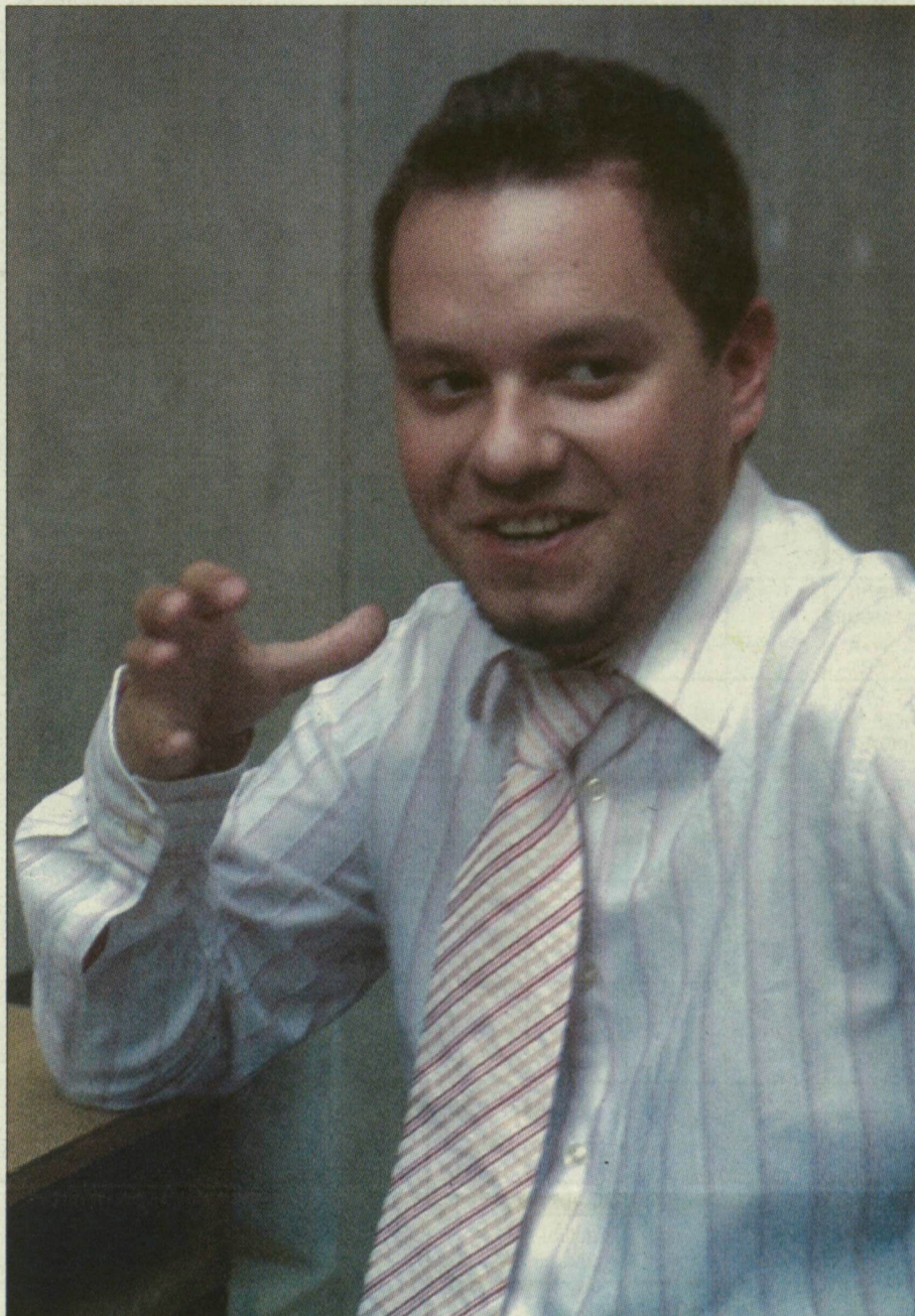
„Annyi szeretetet és elismerést kaptam az eddigi munkámért, hogy ma már nem cserélném el a sportriporterkedésre”

– Azon túl, hogy óriási megtiszteltetés volt, hogy – Európában egyedülálló módon – elfogadta a meghívásunkat a műsorunkba, természetesen gondoltunk arra is, hogy rizikót is jelent a vállalkozás. Medgyessy Péter érkezése nemcsak nagyobb felkészültséget igényelt, de lényegesen jobban is izgultunk miatta, mint mások esetében. Rádadásul műsorunk alapelve a politikai semlegesség. Mégis elégedettek lehetünk: később kaptunk tőle egy miniszterelnöki elismerést. Arra is büszkék vagyunk, hogy ezt a műsort másfél-kétfélmillió ember nézi meg kéthetente, a másik csatornán velünk párhuzamosan