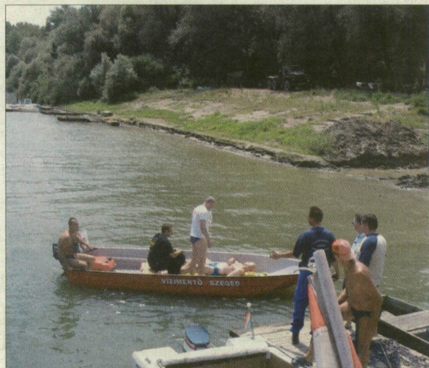
NY. P. A vízi mentők szakszerűen látják el a tiszai balesetek sérültjeit