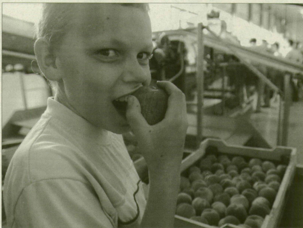
A jó minőségű magyar őszi barack kelendő az EU-országokban