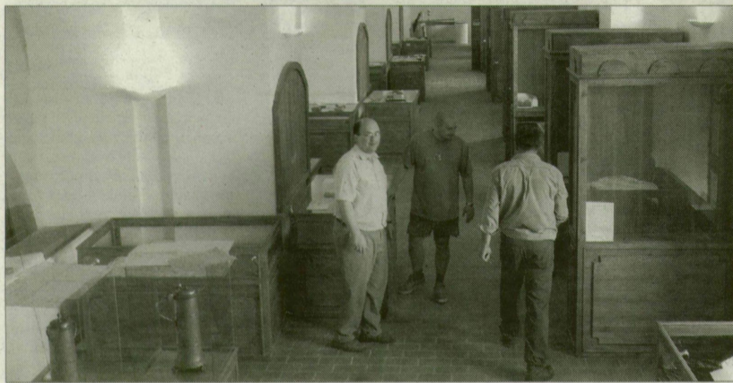
Kiállítások is helyet kapnak a felújított karzaton