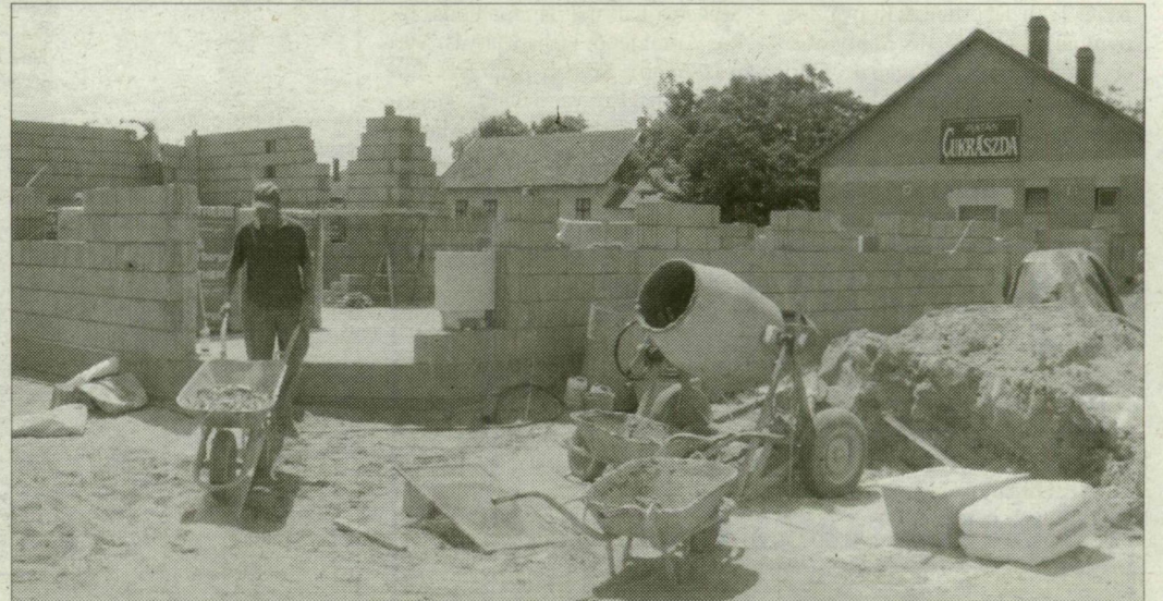
Már állnak az új pénzügyi szolgáltató falai

A beruházás több tízmillió forintba kerül. A költségek teljes egészét a szövetkezet állja. A korszerű, bankautomatával is felszerelt intézmény ügyféltérben három ablaknál szolgálják ki a balástyaikat.