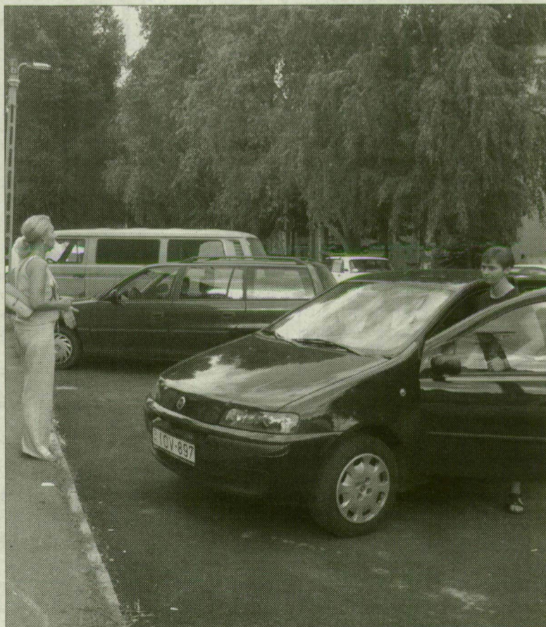
A környékbeliek birtokukba vették az új parkolót