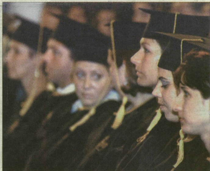
Először talárban. A szegedi Belvárosi moziban kapták meg diplomájukat a végzősök.

Már csak négy csapat reménykedhet, hogy megnyeri a labdarúgó Európa-bajnokságot