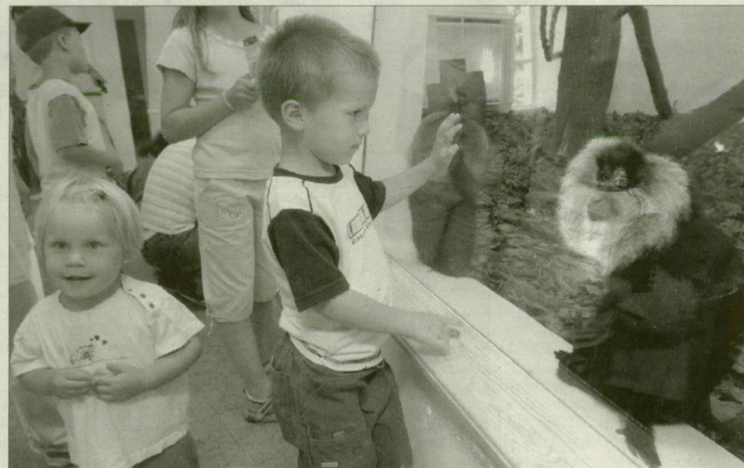
A gyerekek körében máris népszerű az új látványosság