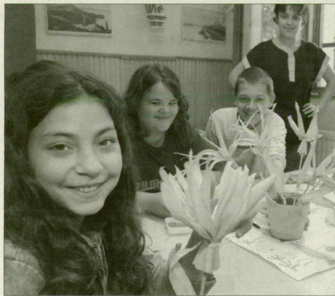
Nyáron kézműves-foglalkozást is tartanak