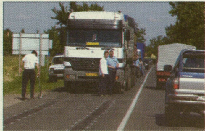
A 17 éves fiú a megállóban várakozó busz mögül lépett a pótkocsis teherautó elé

A gépkocsi vezetője ekkor már nem tudta elkerülni az ütközést, pedig a sofőr olyan erősen fékezett, hogy a gumik métereken át füstöltek. A kukoricát szállító pótkocsis teherautó métereken át görgette maga előtt a fiatalembert, végül az út jobb szélére lökte. A lábán szenvedett súlyos sérüléseket, mentőhelikopter szállította az ügyeletre.