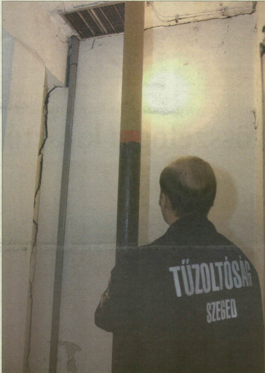
A tűzoltó lefelé, a hatalmas repedés felfelé tart a laktanyában