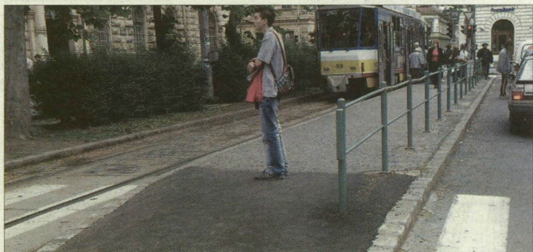
A várakozó-felszálló rész hosszabb lett, a szerelvények azonban nem