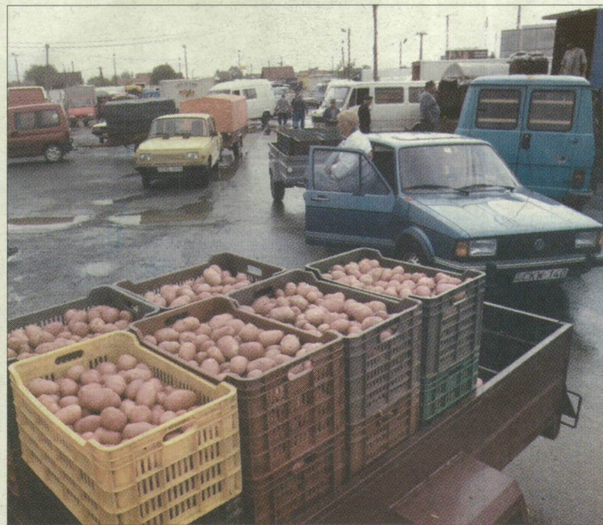
A jelenlegi nagybani Kiskundorozsmán, és a tervezett agrárlogisztikai központ területe