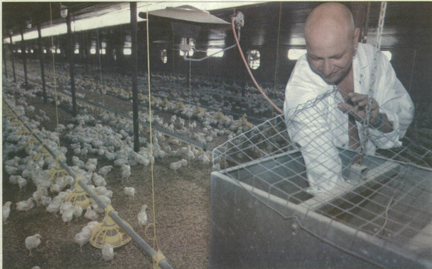
Évente 2 millió 700 ezer csirke kerül ki az üllési és a ruzsai telepről