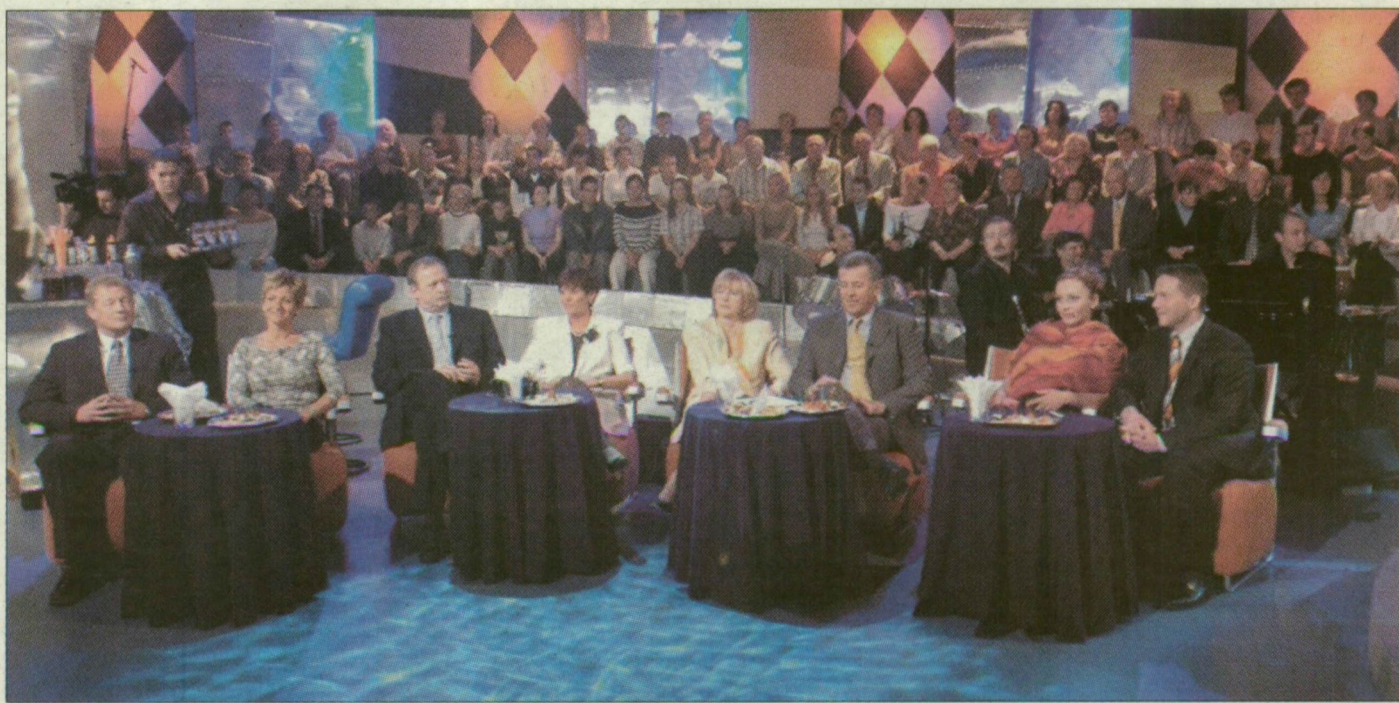
A Herényi, a Kuncze, a Schmitt és az Újhelyi házaspár a Névshowr felvételén