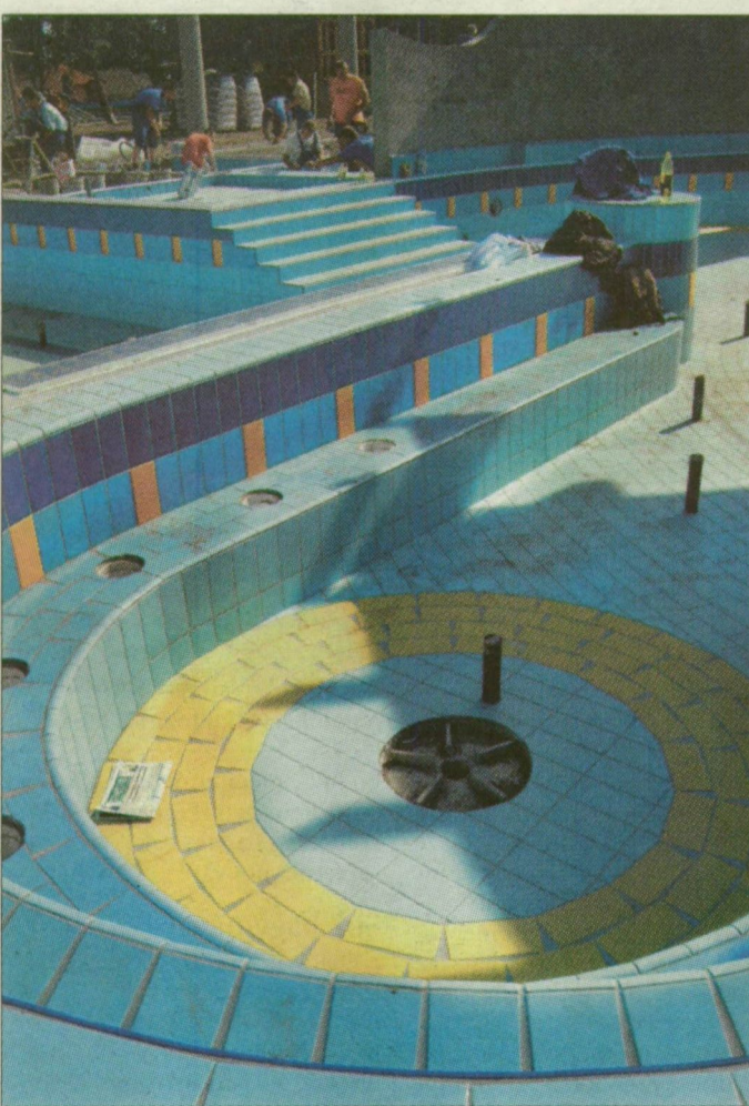
K. T. Készülnek a holnapi átadásra

A mórálhalmi fürdő a tervek szerint két hónap múlva lesz teljesen kész: a legrégebbi épület-szárny helyén háromszintes kiszolgáló épületet emeltek, amelyen most végzik az utolsó simításokat.