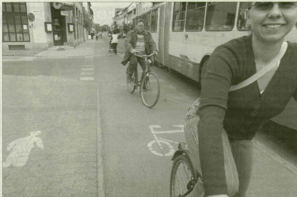
Örülnek a kerékpárosok, ha „átszállás” nélkül kerekeshetnek körbe a Belvárost

Az egyik fő irány az Újszeged–Mars tér tengely, amelyet idén teljesen kiépít a város. Folyamatossá teszik a Fő fasori kerékpárutat és a hiányzó belvárosi szakaszt, a Híd és a Károlyi utcán is átvezetik a kerékpárosokat. A Mikszáth Kálmán utca felújításakor ott már épült egy kerékpárút, de az gyakorlatilag használhatatlan, a forgalmas utcán a járókelők vették birtokba. Hogy itt hogyan