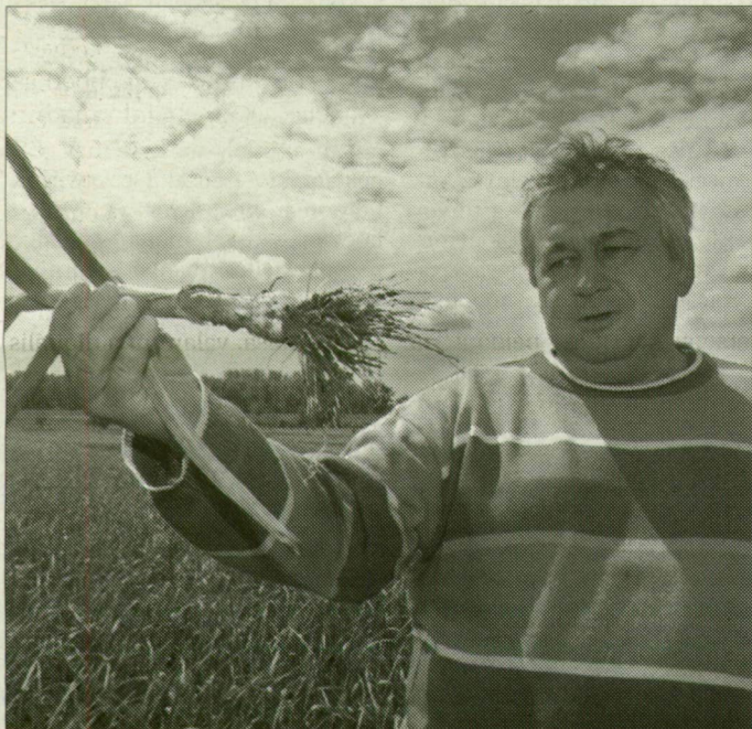
Az őszi fokhagymának eddig kedvezett az időjárás, már csak egy kis meleg kellene