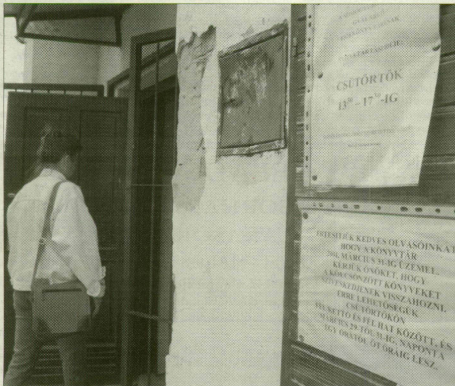
Az omladozó falú gyálaréti épület csak a nevében művelődési centrum

A gyálaréti művelődési ház felújítására, bővítésére ez évben 20 millió forintot szán a város. Ez az építkezés első ütemének megvalósítására elég, a tervek júniusban