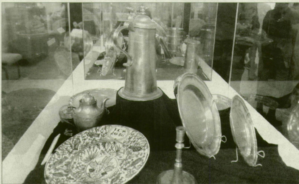
A főúri terítéket bemutató kiállítás sok érdeklődőt vonzott a Fekete Háza