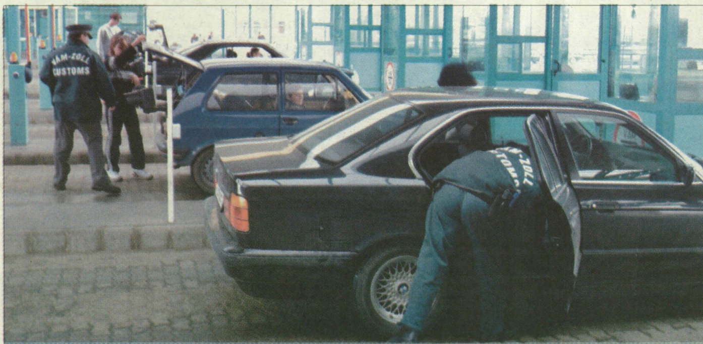
A vámósoknak már nemcsak az autókat, hanem a lakcímet is ellenőrizniük kellene