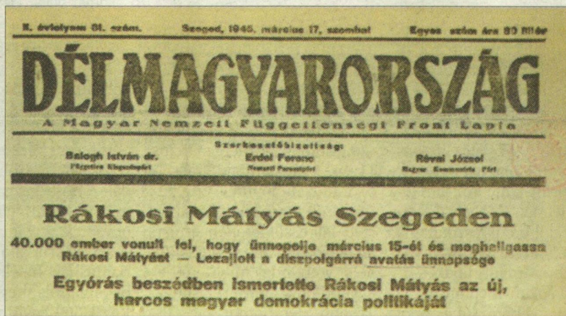
A Délmagyarország beszámolója Rákosi Mátyás díszpolgárrá választásáról

A városi tanács által javasolt konzervatívokkal szemben a városi választott község tagjai a haladást szorgalmazó