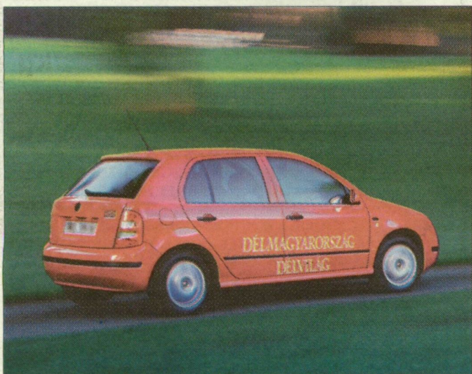
Nem babra, Skoda Fabiára megy a játék

Csütörtökön és pénteken 10-15 perces előadásokat hallgathattak meg az érdeklődők különféle állati eredetű emberi megbetegedésekről, valamint az ezzel kapcsolatos védekezésről és élelmiszer-biztonságról.