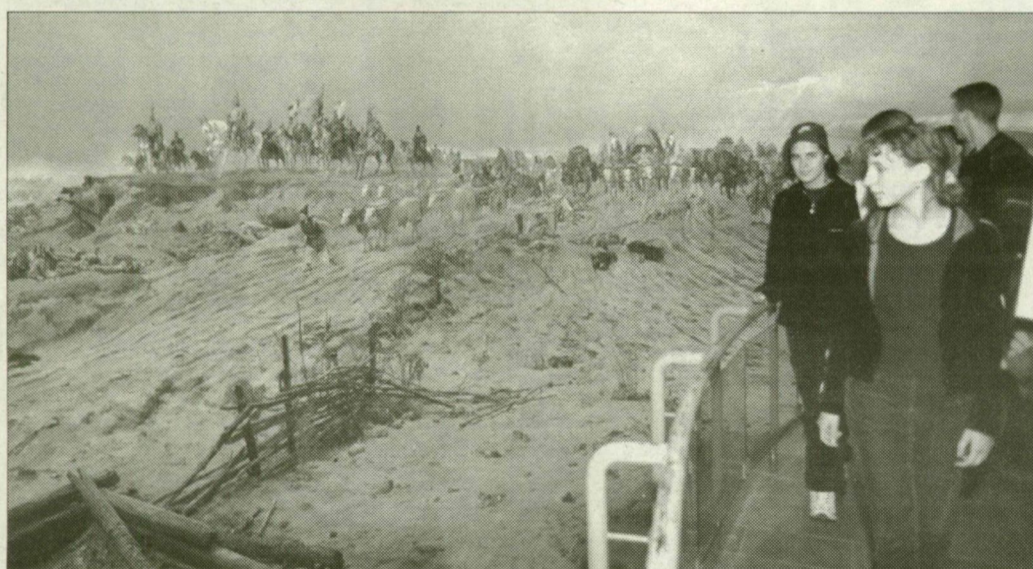
A Magyarok bejövetele 1996 óta látható újra

Feszty apósától, Jókai Mórtól kapta a tanácsot, hogy a honfoglalás millenáriumára magyar történelmi témát válasszon. Családi részvénnytársaságot alapított, és a mai Szépművészeti Múzeum helyén telket bérelt, ahová Feszty Adolf megtervezte a kör-