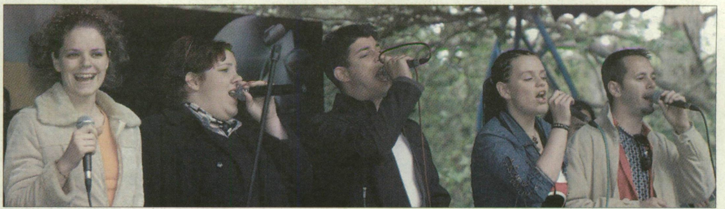
A Megasztár-csapat nagy sikert aratott