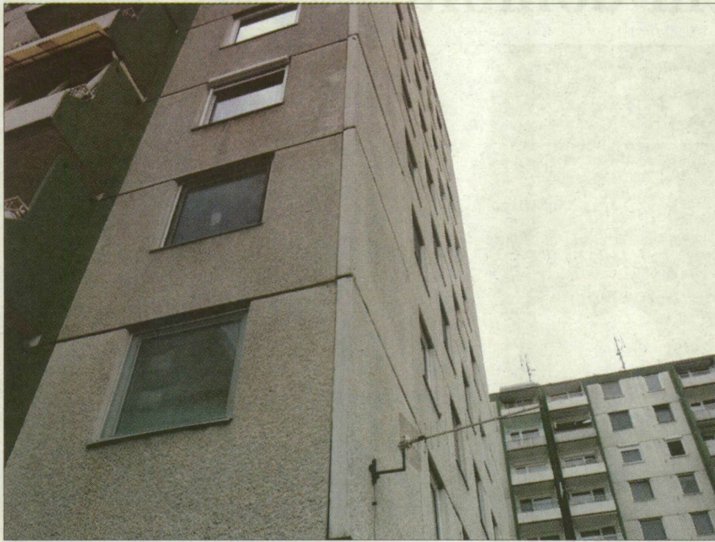
Nagy valószínűséggel lakótelepi lakásokat kínálnak majd az eladók

A drágaság mellett más is indokolja, hogy a használtlakás-piacon nézzenek körül: nagyobb ütemben kellene emelni a bérlakások számát. Jelenleg