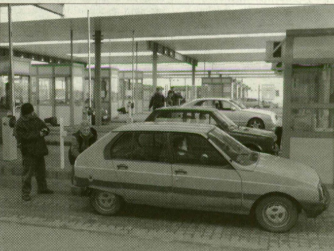
A rószkei határon. Schengentre már készülni kell.

A vita tehát zajlik. Mert vitában mi, magyarok igencsak nagyot tudunk alakítani. Hogy azután ez a rengeteg érvelés mikor vezet el a megoldáshoz, ma még talány. De azt talán mégsem kellene megvárunk, míg száz 16 évesből mondjuk ötven vallja be, persze név nélkül, szemét lesütve, ő bizony már járt a drogmennyországban.