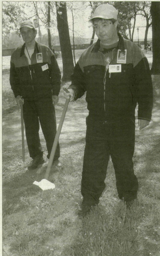
A szolgálat megújult, a zöld bot a régi

Tapasztalataik szerint a lakótelepeken konténerekbe összegyűjtött szemetet általában a hajléktalanok szortírozzák, amivel nem is lenne probléma, de sok esetben szétdobálják a területen