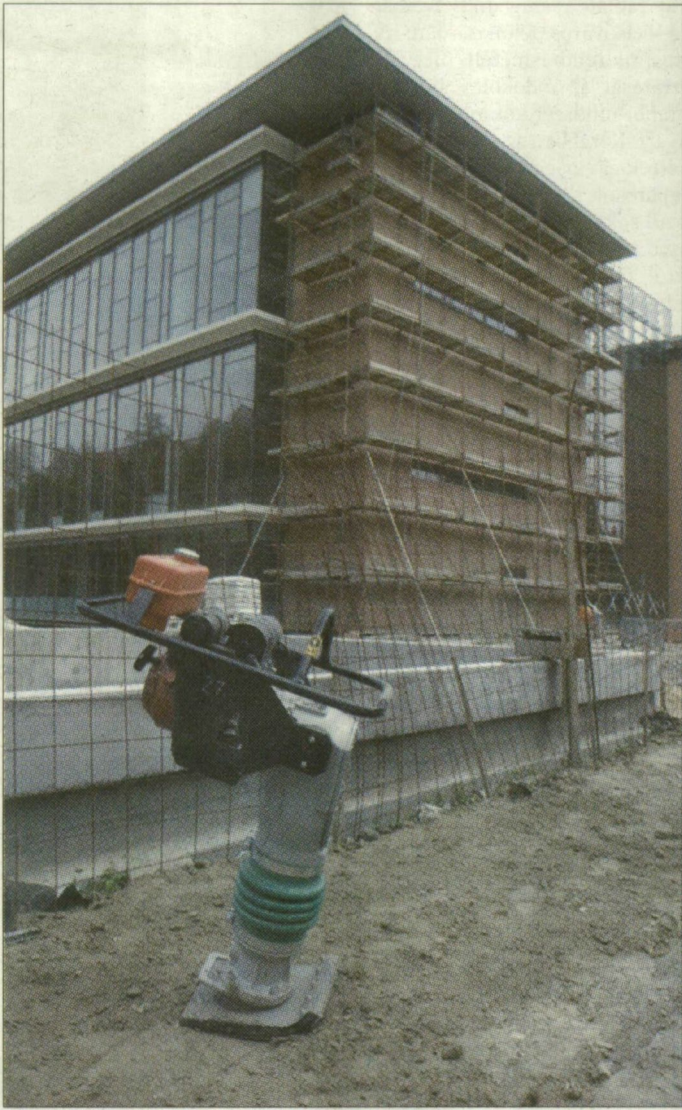
A pénztelenség kiűrtette az építési területet

A részvénytársaság elnök-vezérigazgatója mintegy három hete még arról nyilatkozott, hogy a megállapodás szerint, szeptember 4-re elkészül az épület. Kézér Gyula