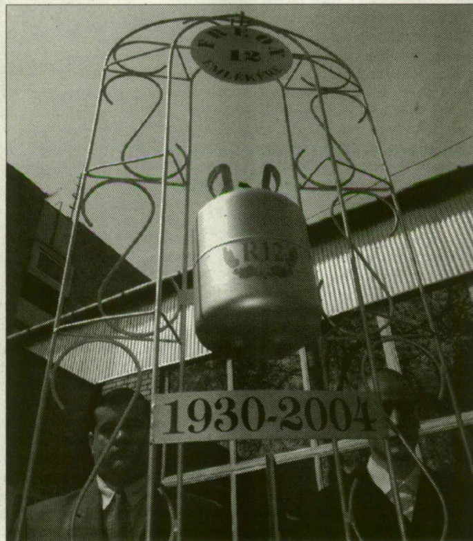
A freon 12-nek állított emlékoszlop