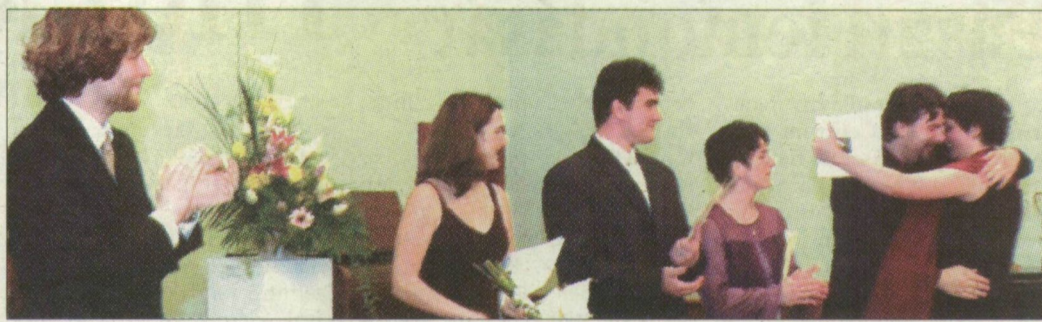
A szegedi győztesek egymásnak gratulálnak a díjátadó gálán