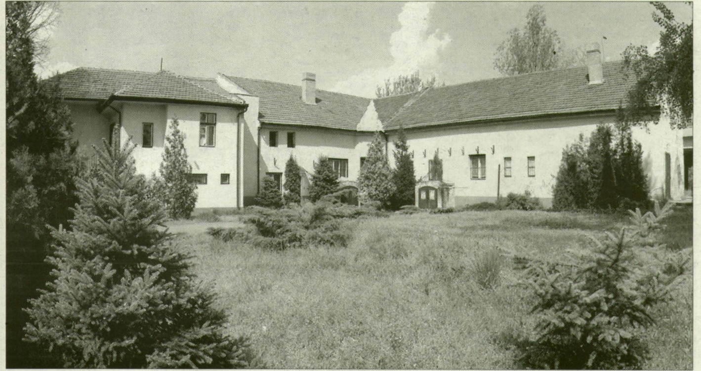
A népművészek nem költözhetnek vissza