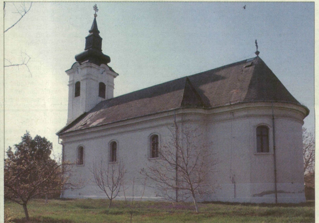
A patinás épület renoválására évtizedekig nem jutott pénz