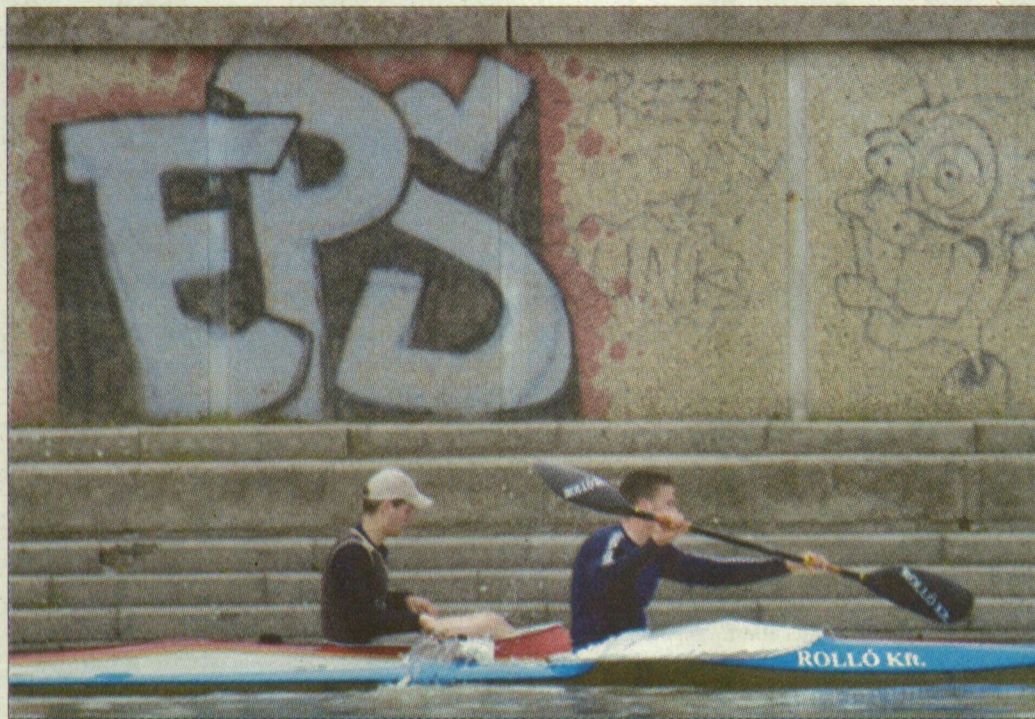
Szegeden a partfalat is végig elcsúfították a graffitisek

Mészáros a feladatok szervezésére, koordinálására szeretett volna létrehozni egy alapítványt, ám az végül nem valósult meg. El-