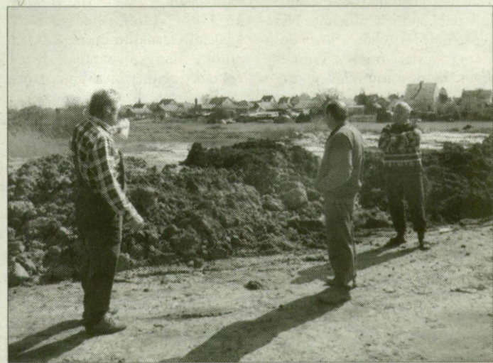
A Basahíd és Rigómező utcában lakók aláírásokat gyűjtöttek a munka leállítására