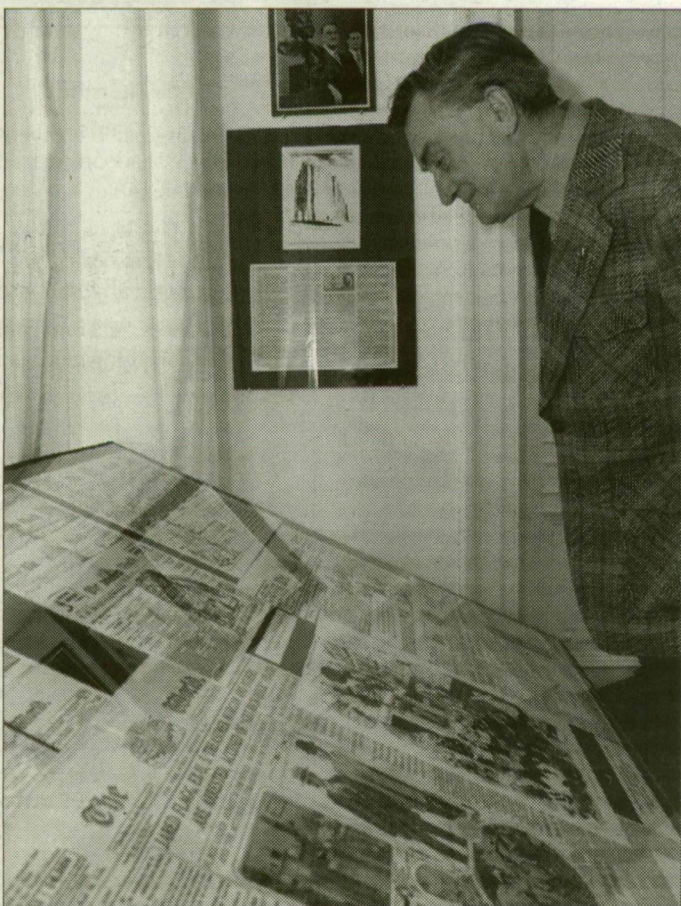
A május 31-éig megtekinthető kiállítás festmények, fotók, korabeli újságoldalak, dokumentumok alapján készült.

A hazai Pulitzer-kutatás elindítója, Csillag András főiskolai tanár nyitotta meg a Móra Ferenc Múzeumban azt a vendéghiállítást, amely a modern újságírás makói születésű úttörőjének, Pulitzer Józsefnek állít emléket. Az Egyesült Államokban sajtócézárrá lett Pulitzer 1847. április 10-én született, 1864-ben emigrált, 1868-ban St. Louisban a Westliche Post-nál kapott riporter állást. Házassága révén nagy vagyont szerzett. 1883-ban vásárolta meg a The New York World című lapot, amelynek példányszámát 12 ezerrel – merész újításának köszönhetően – rövid idő alatt 200 ezer fölé tornáztta. Amerika sajtócézárává vált, nevéhez köthető a Szabadság-szobor felállítását elérő sajtókampány megszervezése, és ő volt az első magyar kongresszusi képviselő. 1903-ban a New York-i Columbia Egyetemen megalapította a Pulitzer-díjat és az a világ első újságíró-fakultását. 1911-ben bekövetkezett halálakor lapjai 700 ezer példányban jelentek meg.